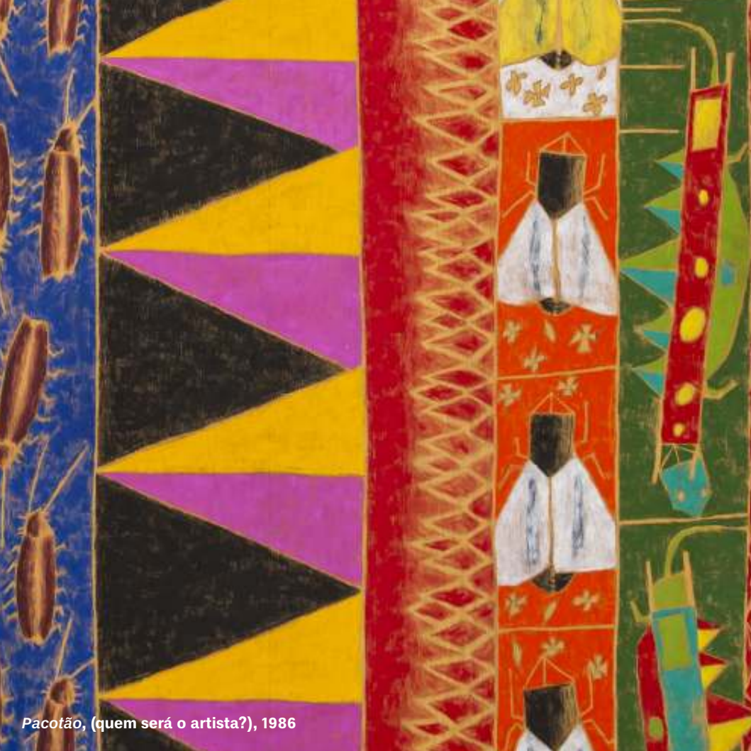
Pacofão, (quem será o artista?), 1986