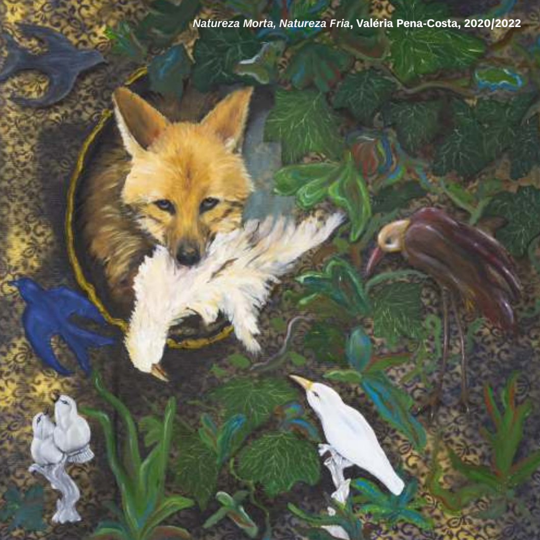
Natureza Morta, Natureza Fria, Valéria Pena-Costa, 2020/2022