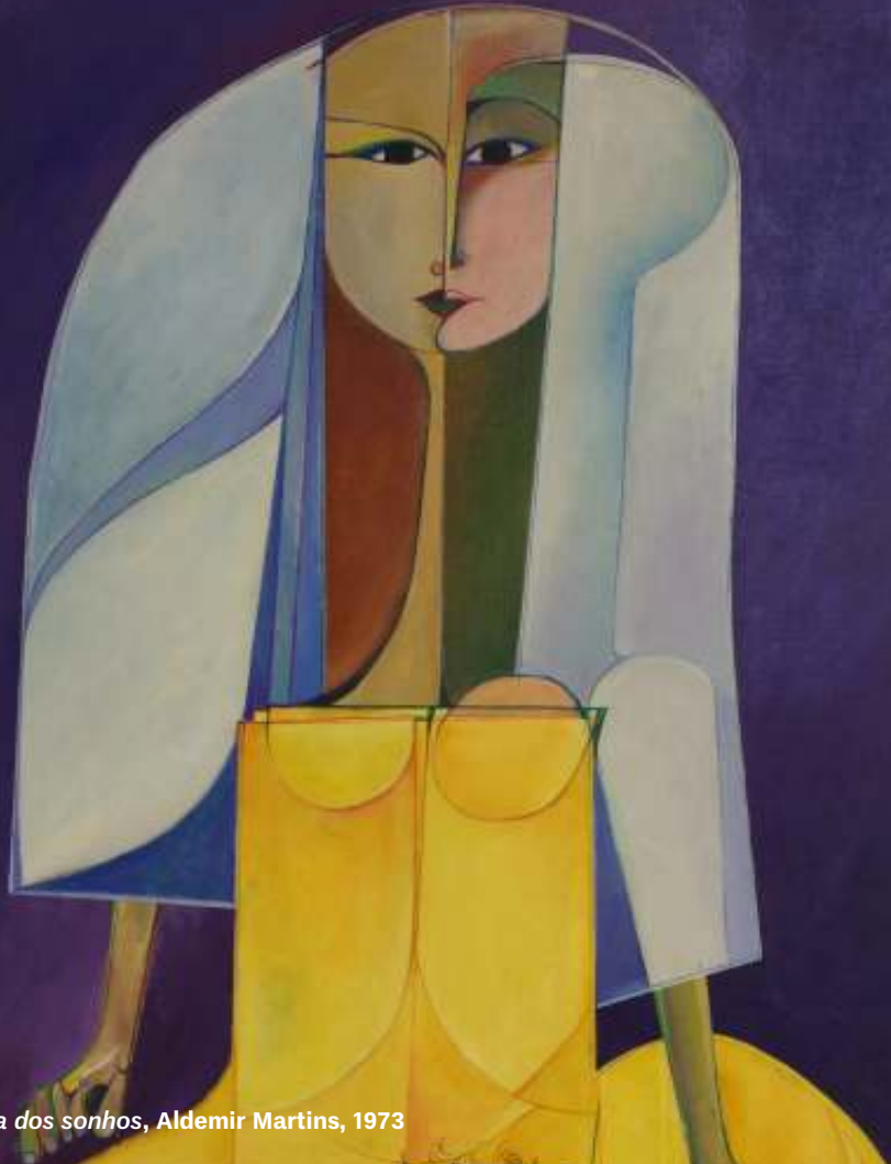
Rendeira dos sonhos , Aldemir Martins, 1973