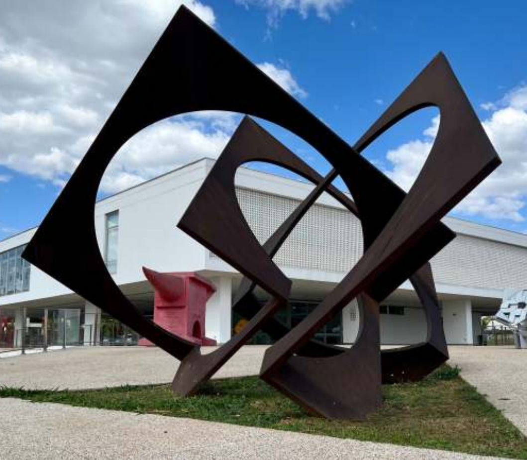
Homenagem à Democracia, Franz Weissmann, 1989