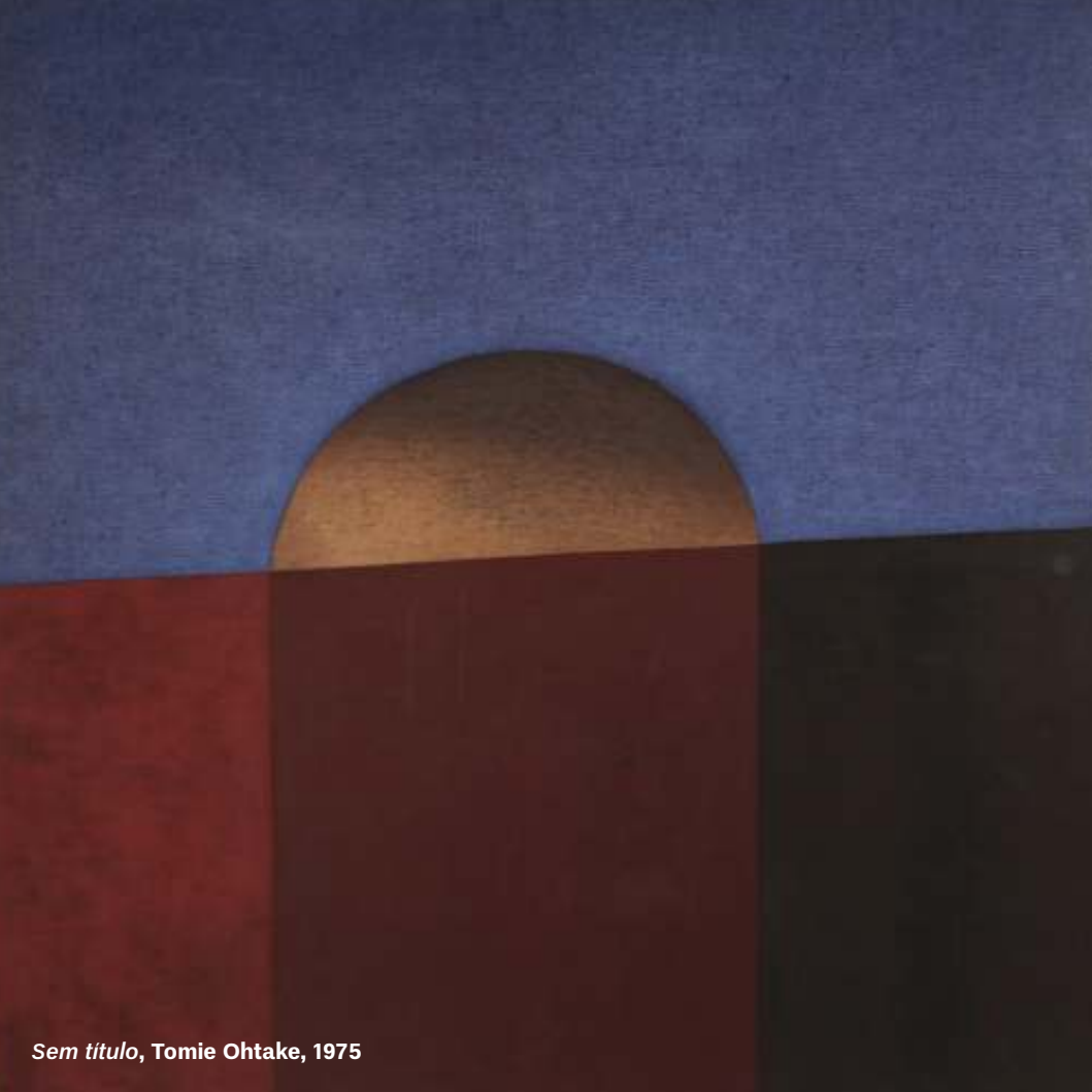
Sem titulo , Tomie Ohtake, 1975